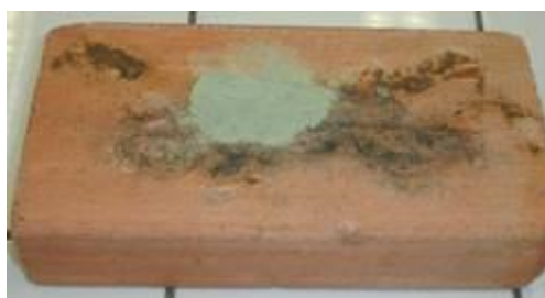
Sur une brique, on place le mélange