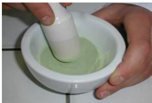
Mélange fer-soufre dans un mortier