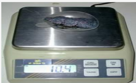
Solide noir grisâtre poreux et friable