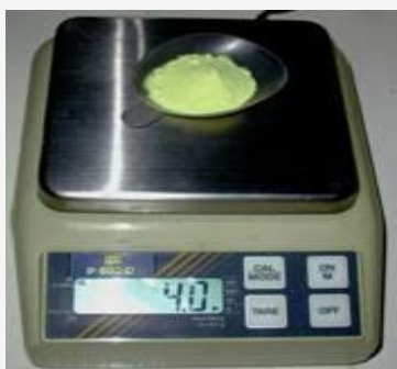
Pesée du soufre