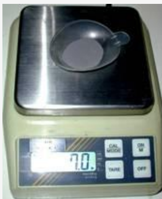
Pesée du fer